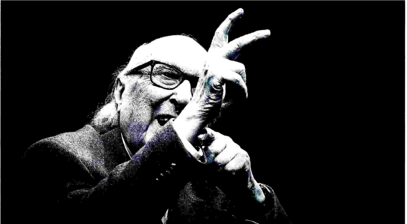
Andrea Camilleri. Collezione record di vendita con il suo commissario Montalbano, tornato in azione con "L'altro capo del filo" (Sellerio, pp. 301 euro 14)